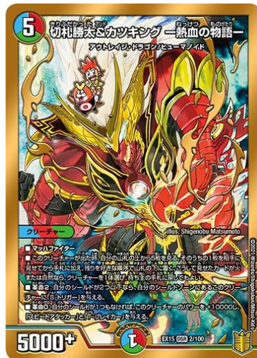
【切札勝太 & カツキング —熱血の物語—】