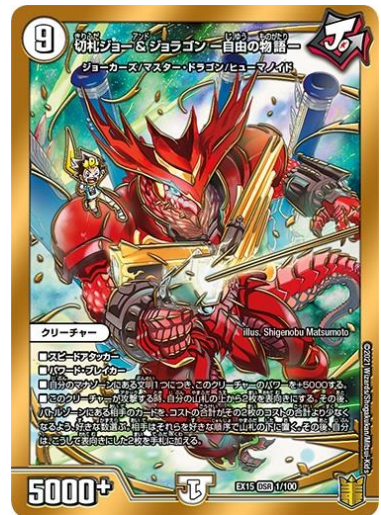
【切札ジョー & ジョラゴン —自由の物語—】

歴代主人公の切札として活躍した、往年の人気クリーチャーがパワーアップ。イラストは原作者・松本しげのぶ先生による本商品のための描き下ろし。実際のカードはゴールドフレームのホイル仕様。