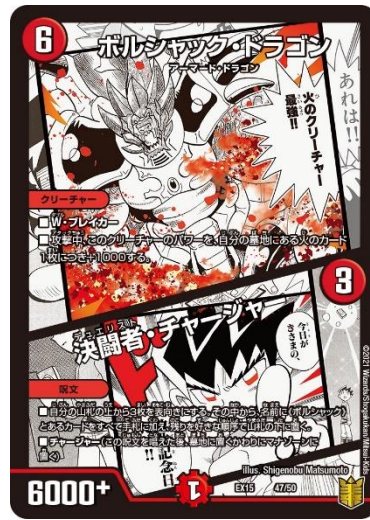
【ポルシャック・ドラゴン】