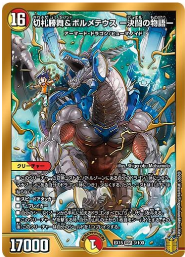
【切札勝舞 & ボルメテウス —決闘の物語—】

「ポルシャックライシス・NEX」(左)は、過去に「ブラックボックス」パックで1度だけ発売された超人気レアカード。特別イラストになって再収録。そのほかにも本商品には、まんがやアニメのイラストやCGが描かれたコレクタブルなカードを多数収録。