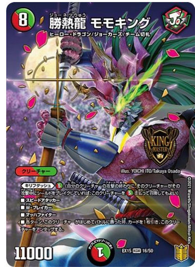
【勝熱龍 モモキング】

「ポルシャックライシス・NEX」(左)は、過去に「ブラックボックス」パックで1度だけ発売された超人気レアカード。特別イラストになって再収録。そのほかにも本商品には、まんがやアニメのイラストやCGが描かれたコレクタブルなカードを多数収録。